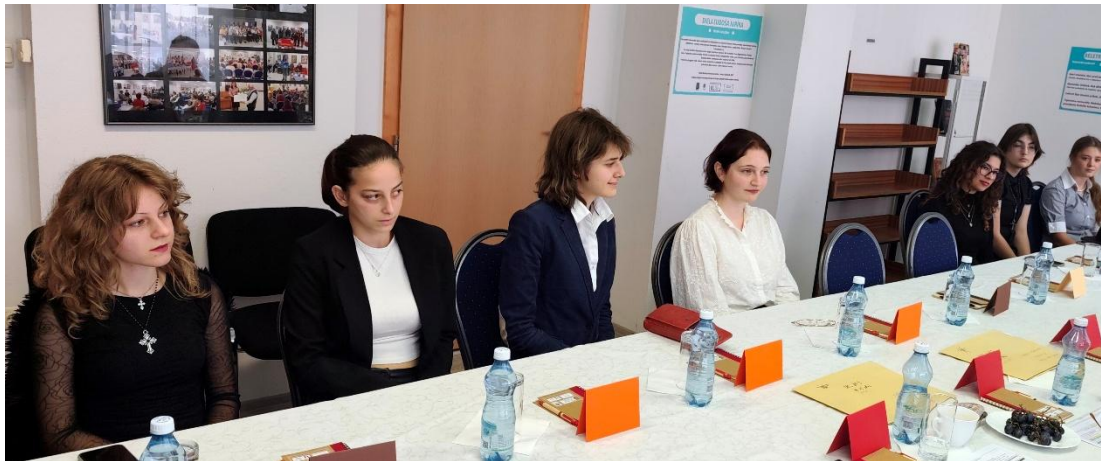
Pohľad na mladých autorov, účastníkov stretnutia