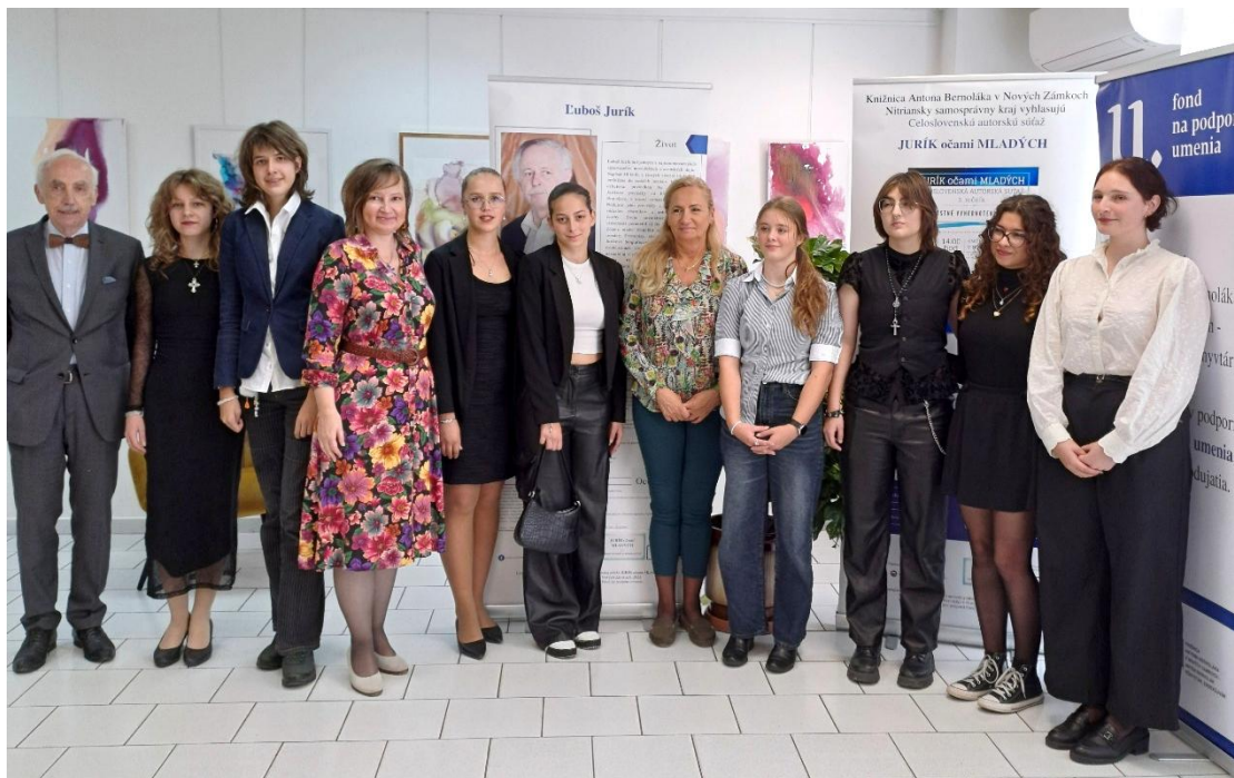
Porotcovia a prítomní autori