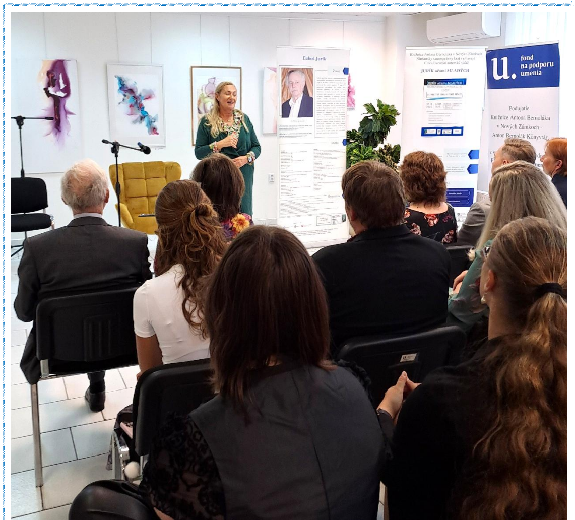
Porotkyňa hovorí o súťaži