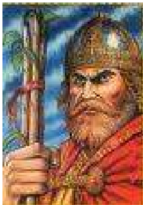
Kráľ Svätopluk I. *?-†894